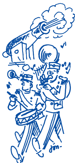
SALUTT - MUSIKK .