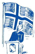
TALE FOR FLAGGET